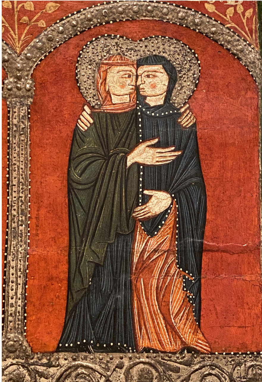
Frontal d'altar de Mosoll, musée National d'Art de Catalogne, Barcelone

« Oyé braves gens ! N'avons-nous point d'imagination pour répéter sans cesse les mêmes morts ? »